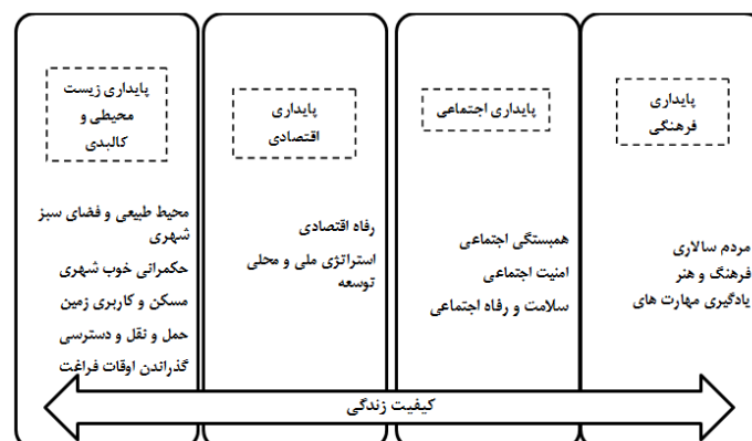
شکل ۱- چهارچوب مفهومی کیفیت زندگی (مأخذ: فرجی‌ملانی، ۱۳۸۹- الف)

با توجه به پیچیدگی مفهوم کیفیت زندگی، چهار رکن اساسی، مفهوم کیفیت زندگی شهری را در بر می‌گیرد. این چهار رکن عبارتند از: پایداری اقتصادی، پایداری اجتماعی، پایداری محیطی و پایداری فرهنگی-سیاسی (رهنمائی و همکاران، ۱۳۹۱: ۵۰).